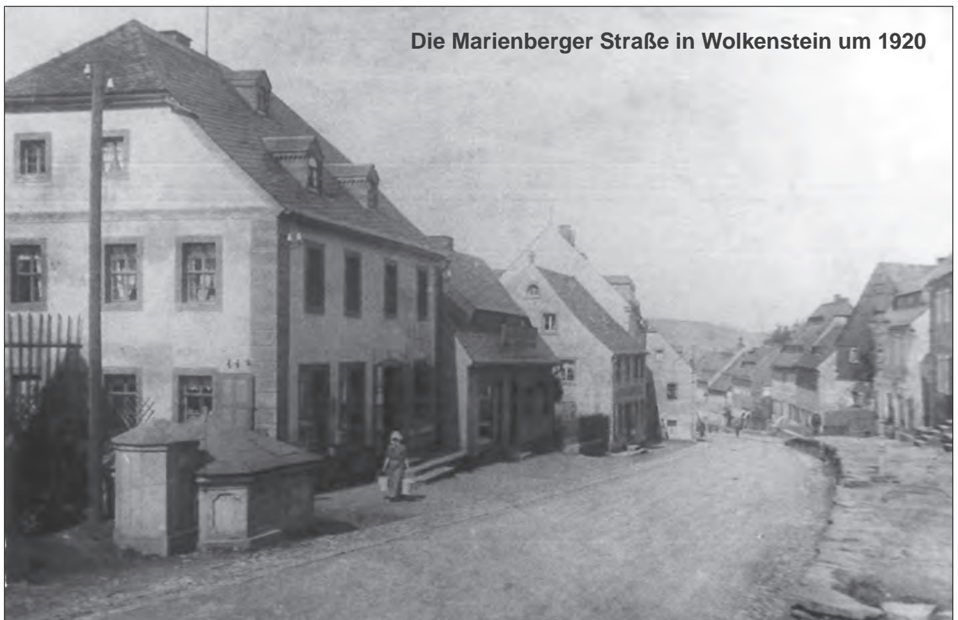
Die Marienberger Straße in Wolkenstein um 1920